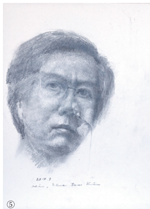
①《白布の静物》1973年 ②《還暦過ぎた自画像》2010年頃 ③《廃屋》1969年 ④《田中一村住居跡》2005年 ⑤《無題》2014年