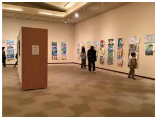
第21回ミマサカコドモ絵画展のようす