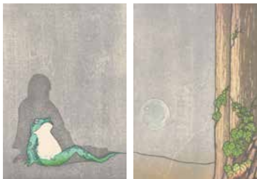
右「一本足の女 壺」左「一本足の女 式」水性木版 坂手江美

勝央美術文学館ゆかりの作家 岡本綺堂(1872-1939)の『青蛙堂鬼談』が1926(大正15)年3月25日に春陽堂から刊行されて100周年となる本年、岡山を拠点に活動する「木版画の雨玉舎」坂手江美(1976-)が「青蛙堂鬼談」12篇をモチーフに制作した木版画の新作を、当館の収蔵する岡本綺堂「青蛙堂鬼談」の書籍・直筆原稿などと併せて一堂に展示します。