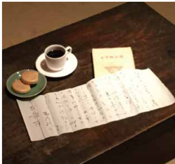
芥川龍之介『木村毅宛書簡』(大正14年8月20日)

本展では平成28年に購入した新資料『芥川龍之介書簡(木村毅宛)』(1925.8.20)から、大正・昭和を代表する文学者・芥川龍之介(あきたがわりゅうのすけ/1892 - 1927)と、勝央町出身の文学者・木村毅(きむら き/1894 - 1979)をご紹介します。大正末期から昭和の初めにあった短い交流の様子を、作品だけでなく、書簡やノートなどから考察します。日本近代文学館(東京)所蔵の死の直前まで芥川が使用していた愛用の品なども展示いたします。晩年田端で過ごした、交流の中から見えてくる、文豪・芥川の素顔に触れてください。