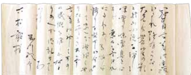
芥川龍之介『木村毅宛書簡』(大正14年8月20日)

展覧会初日10/17には、朗読会、児童文学評論家・赤木かん子氏によるワークショップ(要予約)を開催。また、11/23(金)には、芥川が長く過ごした田端にある田端文士村記念館学芸員・木口直子氏、小説家で芥川龍之介に深く触れた『六の宮の姫君(東京創元社)』の著者である北村薫氏による講演会(要予約)を開催。詳細は、勝央美術文学館へお問合せください。