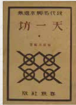
額田六福『天一坊』(春秋社、1926)