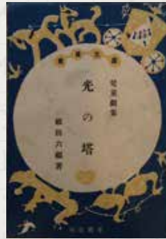
額田六福『児童劇集 光の塔』(愛育社、1946)