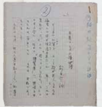
額田六福草稿「自著とその上演俳優」