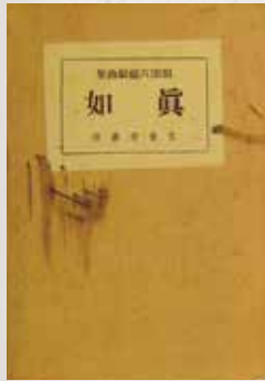
額田六福『真如』(文泉堂書店、1922)