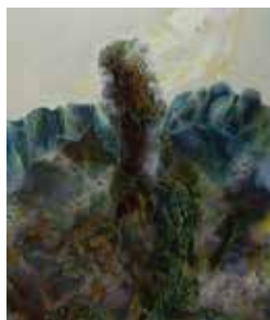
《うまれてきてごめんなさい I》 2019 木製パネル 白亜地 油絵具 テンペラ絵具 1940×1620mm