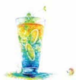
《Blue》 2018 画用紙 水彩絵具 色鉛筆 200×200mm