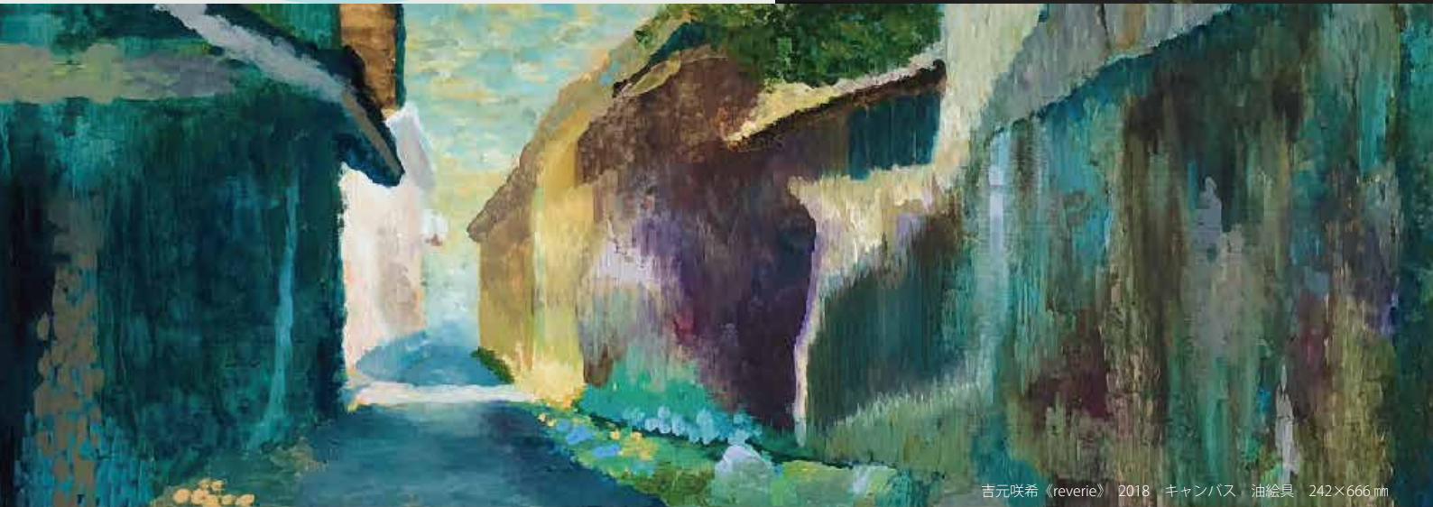
吉元咲希 《reverie》 2018 キャンバス 油絵具 242×666 mm