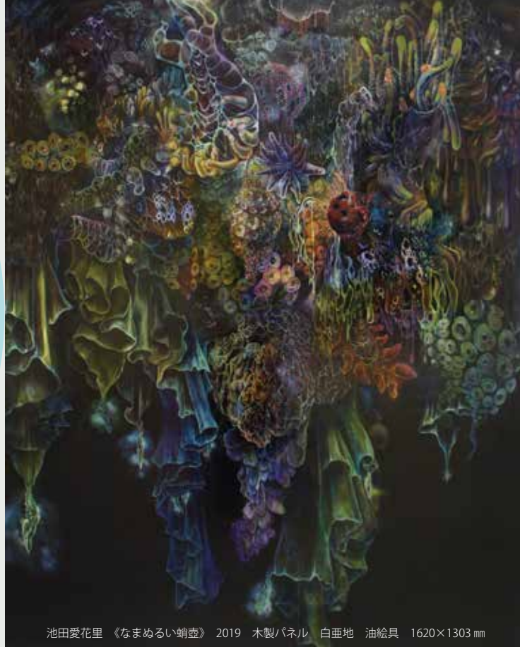
池田愛花里 《なまめるい蛸壺》 2019 木製パネル 白亜地 油絵具 1620×1303 mm