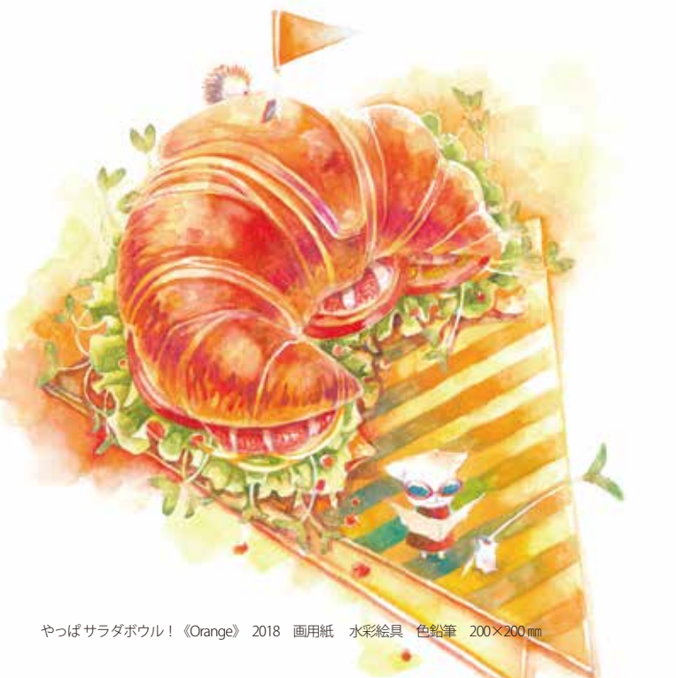
やっば サラダボウル! 《Orange》2018 画用紙 水彩絵具 色鉛筆 200×200 mm