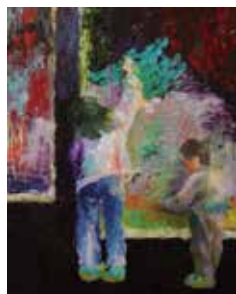
《地に足つかぬ》 2016 キャンバス 油絵具 オイルパステル 652×530mm