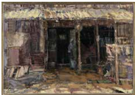
高山始 《牛のいる家》 昭和53

2013(平成25)年に亡くなった勝央町出身の洋画家の水野恭子と高山始の作品を中心に紹介。それぞれ晩年精力的に取り組んだテーマ「桜」と「牛小屋」に焦点をあて、その代表作を展示。その他、勝央町出身の福島金一郎や水野の師である勝央町出身の赤堀佐兵、高山始と関係の深い光風会岡山支部の作家たちの作品など20点あまりを紹介。