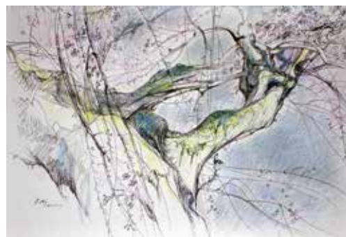
水野恭子<小淵沢の桜> 2000(平成12)年/35.2×50.0cm/キャンバスに油彩

当館の所蔵作品から、郷土ゆかりの作家を中心に紹介するシリーズです。今回は、共に2013(平成25)年に亡くなった勝央町出身の洋画家の水野恭子と高山始の作品を中心に紹介します。それぞれの作家が晩年精力的に取り組んだテーマ「桜」と「牛小屋」に焦点をあてて、その代表作を展示。他にも勝央町出身の福島金一郎や水野の師である勝央町出身の赤堀佐兵、高山始と関係の深い光風会岡山支部の作家たちの作品など20点あまりをあわせてご紹介いたします。▲▲